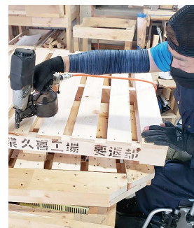
パレット作成風景